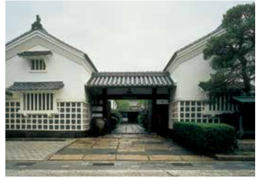
丹波古陶館前景 Old Tamba Pottery Museum